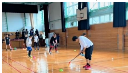
スペシャルオリンピックス日本・東京 『フロアボール体験会』

※NPOまつり交流大会《開催：2023年3月12日(日)》の様態を捉えた写真です。