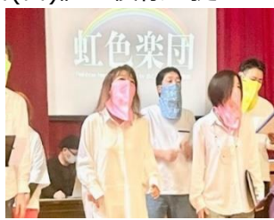
虹色楽団（おとなのバンド倶楽部） 『ライブ・パフォーマンス』